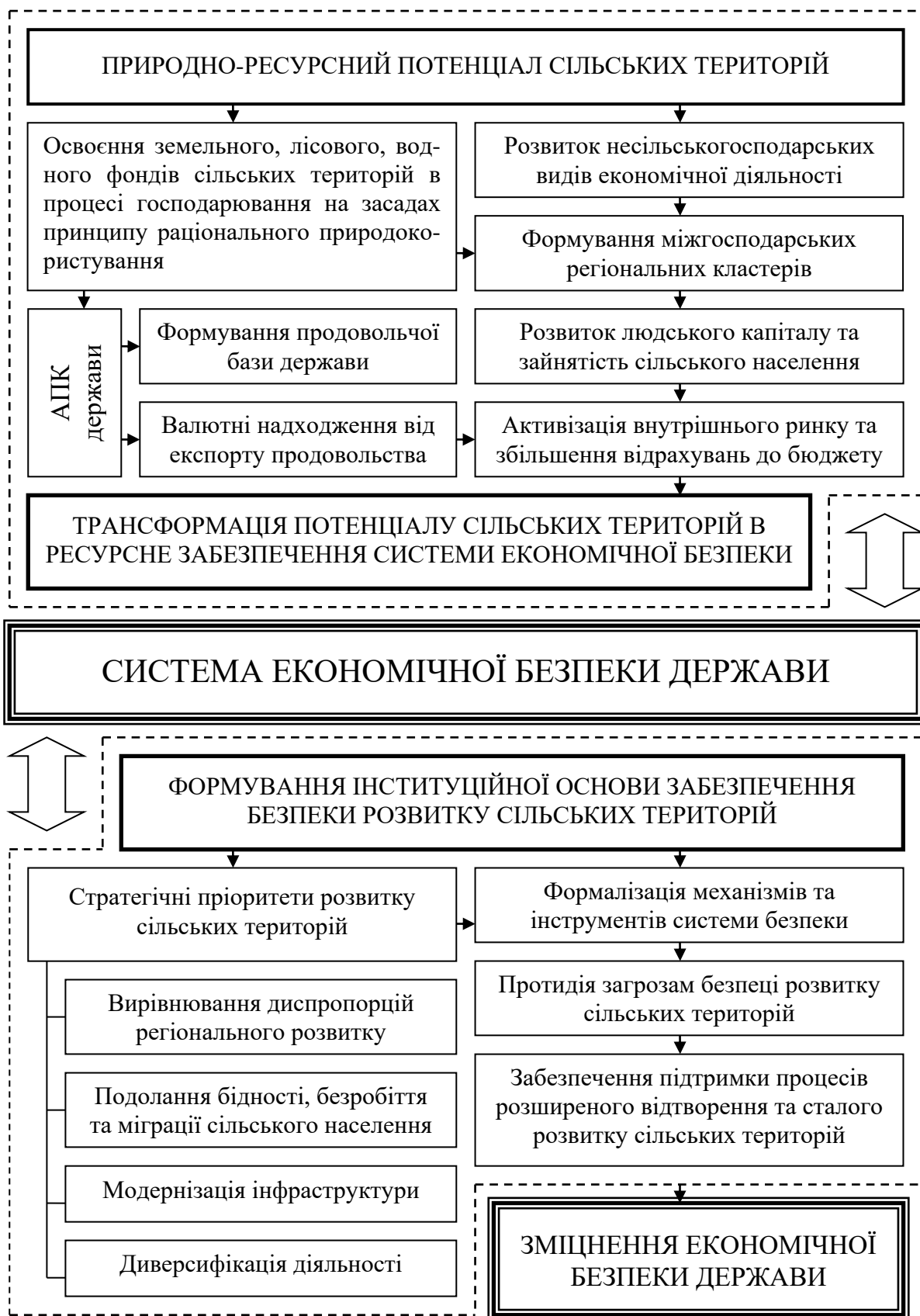
Рис. 1. Взаємозв'язок розвитку сільських територій та економічної безпеки держави*.