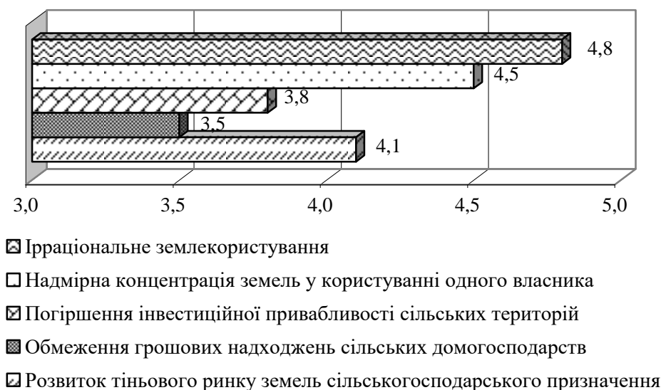
Рис. 2. Результати оцінювання експертами рівня негативного впливу наслідків неврегульованості земельних відносин на розвиток сільських територій (5 балів – суттєво впливає; 1 бал – майже не впливає), 2016 рік*.